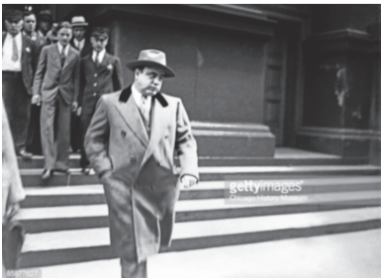
Al Capone szabadulása napján, Chicagóban

bűnöző még életbiztosítást is akart kötni, de furcsamód nem akadt biztosító, amelyik vállalta volna a kockázatot. Al Capone-t ugyanis hiába őrizte több tucat testőr, több alkalommal is csak hajsza híján élte túl az ellene elkövetett merényleteket. Ő sem maradt adós: a szembeszegülőkkel könyörtelenül végzett (olykor saját kezével), emberei 1927-ben még a chicagói rendőrséget is megostromolták. Leghírhedtebb tette 1929-ben a Bálint-napi vérfürdő volt, amikor is egy garázsban a rivális Moran-banda hét tag-