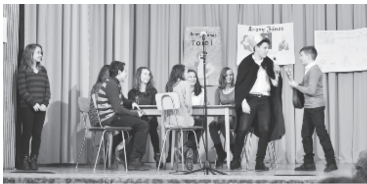
Jelenet A walesi bárdok-ból