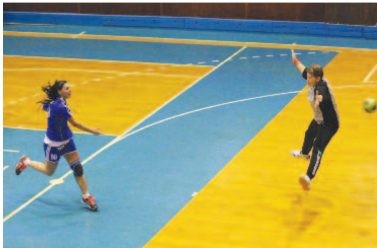
Remekül indult a mérkőzés a házigazdák számára, akik hamarabb megtalálták a réseket az ellenfél védősorában (képünk egy korábbi találkozón készült).

Az első féldél maradék nyolc percében hét gólt dobott a Minaur egy ellenében, illetve a második féldél első két gólját is a vendégek szerezték, azaz tíz perc alatt 9-1-es parciális értéket ért el. Ha azt tekintjük, hogy ezt a fatális tíz percet kivonva