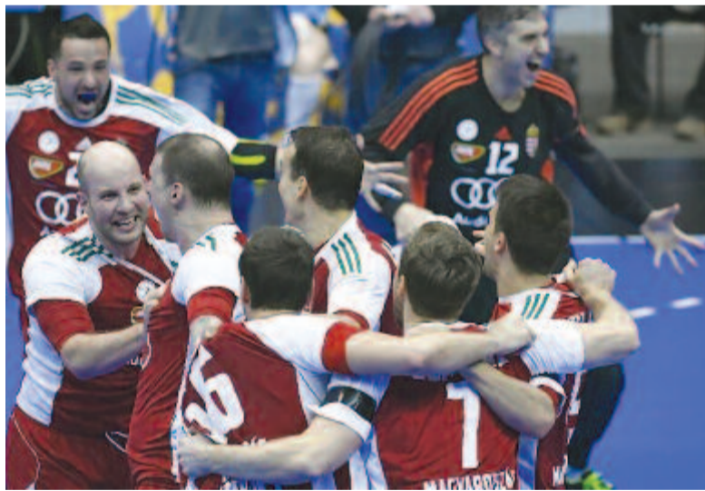
Hatalmas öröm a magyar táborban: 2007 óta nem győztek a dánok ellen, ráadásul felemás csoportszereplésük sem sejtette, hogy ki tudják ejteni az olimpiai bajnokot

A magyar férfikézilabda-válogatott végig vezetve 27-25-re legyőzte az olimpiai bajnok Dánia csapatát a franciaországi világbajnokság vasárnapi nyolcaddöntőjében, Albertville-ben. A két csapat most találkozott egymással 35. alkalommal, ez volt – 14 dán siker és két döntetlen mellett – a 19. magyar győzelem, de 2007. január 20-a óta az első. Akkor a németországi vb-n sikerült ellenük nyerni. A dánok 2005 óta először nem jutottak be a negyeddöntőbe világbajnokságon.